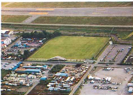
松本市サッカー場