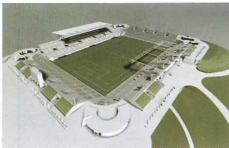
総合球技場完成模型

2002 FIFA WORLD CUP KOREA / JAPAN 2002年ワールドカップサッカー大会 松本キャンプ地 トレーニング等施設図 (松本平広域公園)