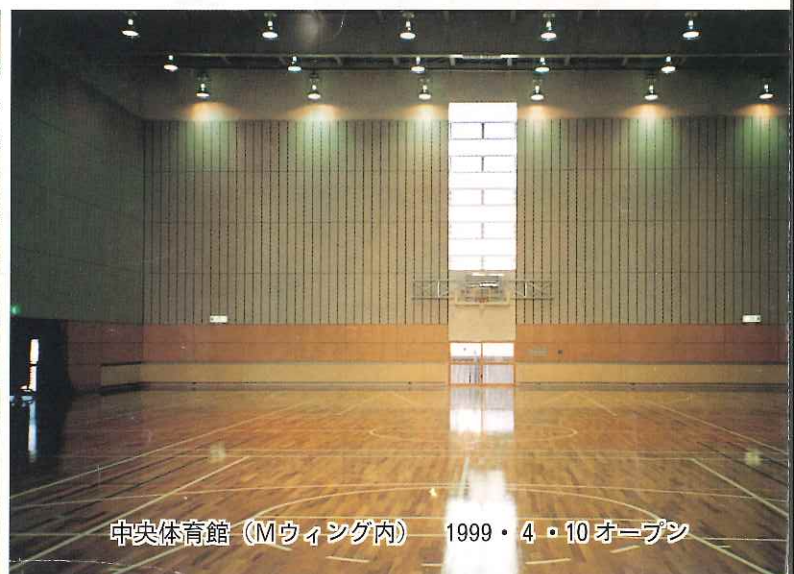
中央体育館 (Mウイング内) 1999・4・10オープン