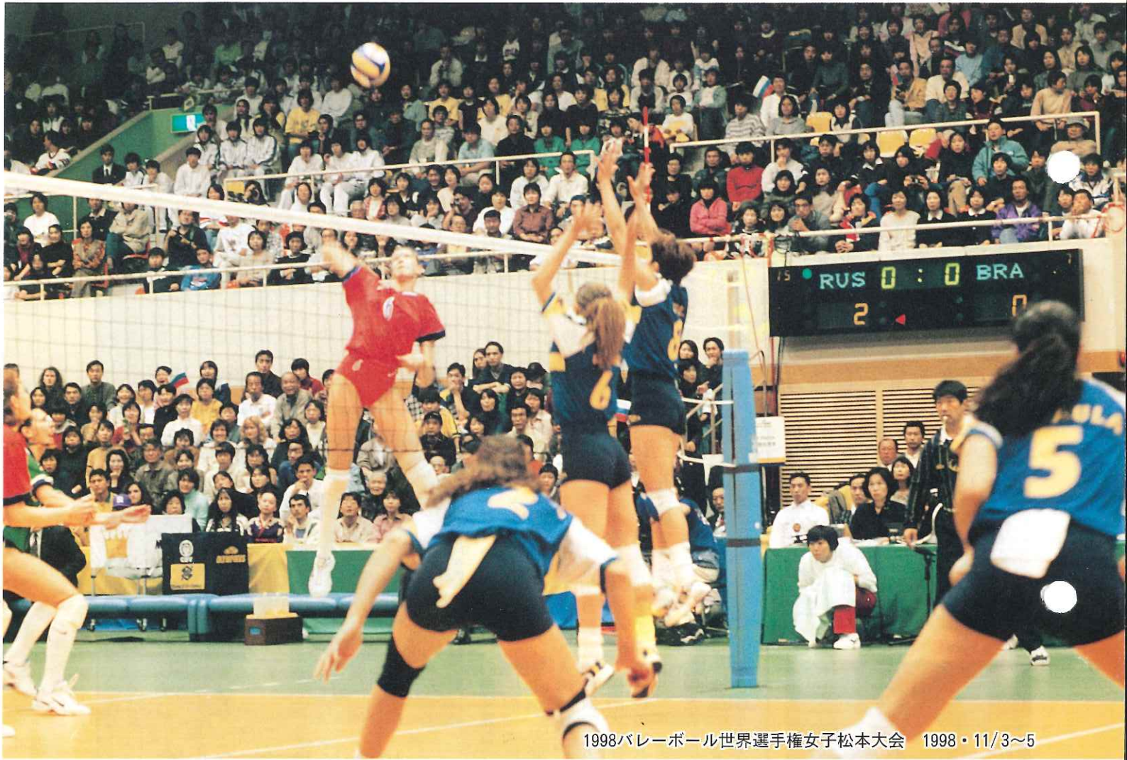
1998バレーボール世界選手権女子松本大会 1998・11/3～5