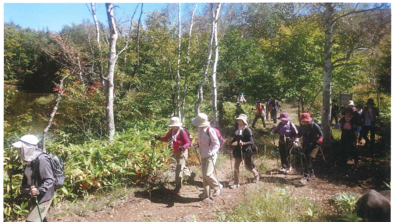
乗鞍高原でノルディックウォーキング

日々の健康維持にはなんといっても運動の継続が有効です。ですが…運動習慣を継続していくのは簡単そうに思えても、実際にはなかなかできないというのがホンネのところだったりしますね。身体ひとつと、ほんのちょっとした意思があれば手軽に取り組める運動のひとつにウォーキングがあります。ウォーキングは、身体に一定の負荷をかけて歩くことで、運動機能の衰えを予防でき、健康維持や気分転換に大いに役立ちます。また、日々の通勤や、お買い物、散歩などの日常歩くときに意識して歩くこともイデですね。ご自分の体力に合った無理のない運動をすることが継続のポイントです。