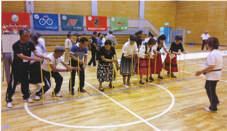
ニュースポーツの指導

各種軽スポーツや、ウォーキング、ストレッチ、レクリエーションなどの生涯スポーツに対応するスポーツ指導者を派遣しています。地域のスポーツ活動をはじめ、中学生のレクリエーション活動や企業・団体の運動指導など幅広く対応します。現在47人の市内各地区でスポーツ指導に携わる指導者が登録しており、地域・内容により楽しい指導ができます。また、運動のイベントを開催してみたいけれどやり方がわからない、種目はどのようなものがあるの?などご不明、お困りのことがありましたらお気軽にご相談ください。