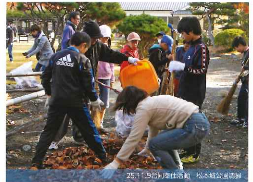
25.11.9合同奉仕活動 松本城公園清掃

〒390-0801 長野県松本市美須々 5-1 松本体育協会内 TEL0263-32-7056