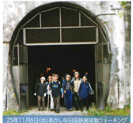
25年11月6日(水) あかしな旧国鉄廃線敷ウォーキング