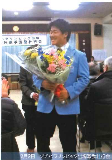
2月2日 ソチパラリンピック出場激励壮行会